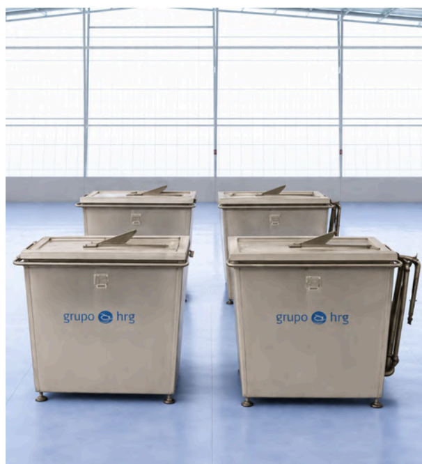
COCEDOR / BALSINA GRUPO HRG 1.100L