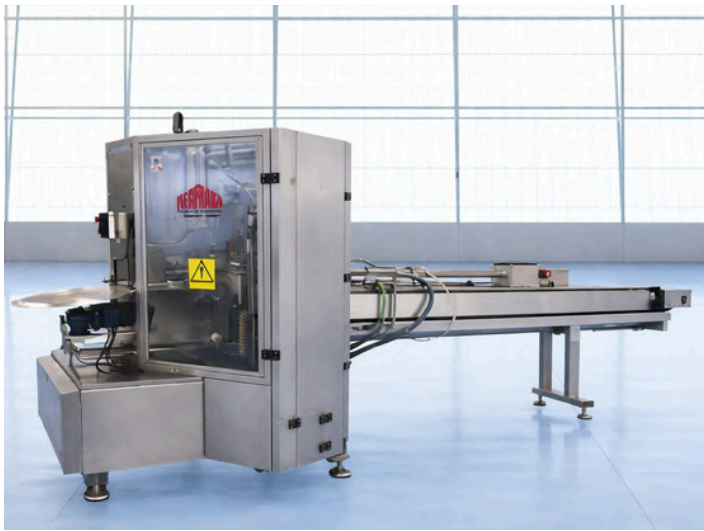
EMPACADORA HERFRAGA SM-200