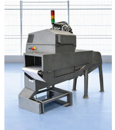
DETECTOR DE RAYOS X METTLER T