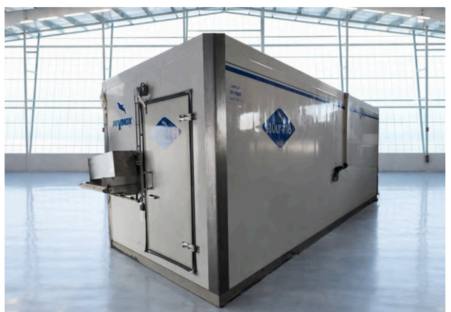
TÚNEL DE SECADO IQF LINEAL PALINOX