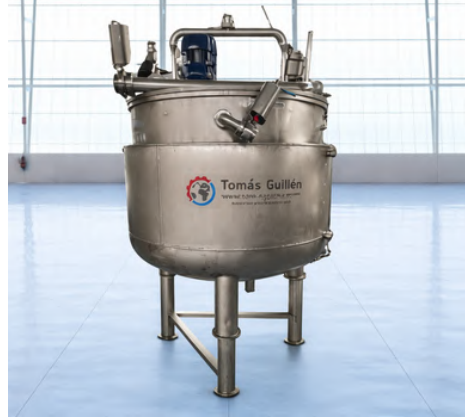
DÉPOSITO DOBLE FONDO CON AGITADOR