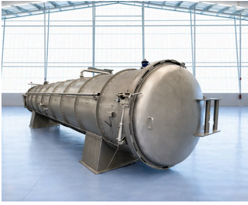
COCEDOR AUTOMÁTICO DE 8 CESTAS