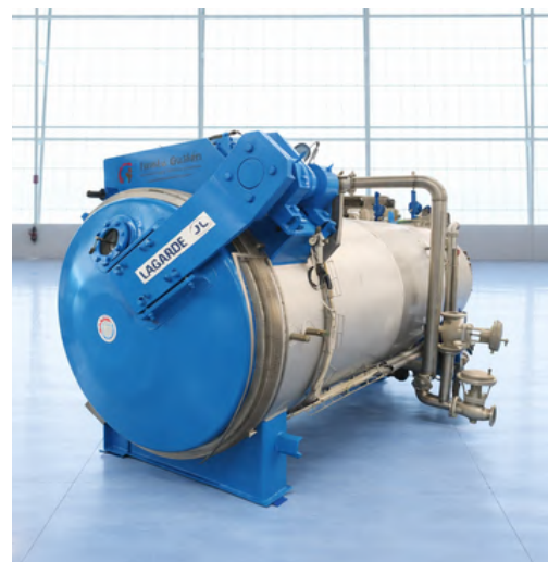
AUTOCLAVE ESTÁTICO LAGARDE 4 JAULAS