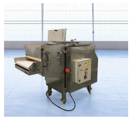
CORTADORA OMAR INOX