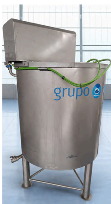
LAVADORA DE CEFALÓPODOS