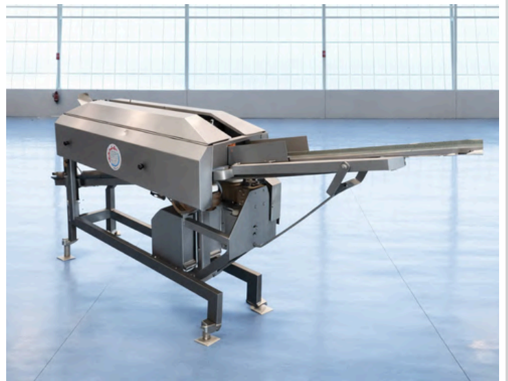
EVICERADORA Y FILETEADORA PARA SARDINA BADER