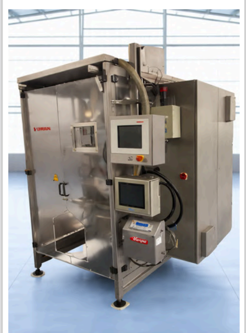
LLENADORA DE BOLSAS ROVEMA