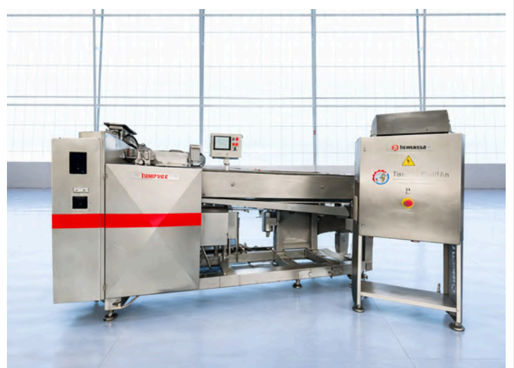
EMPACADORA HERMASA TUNIPACK-500