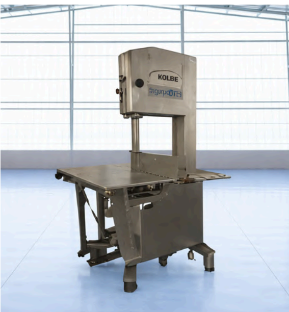
SIERRA DE CORTE KOLBE K440