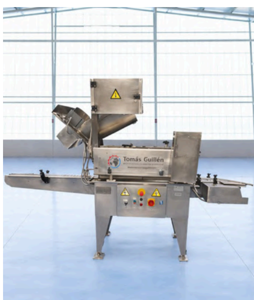
CAPSULADORA AUTOMÁTICA EMERITO 1.8