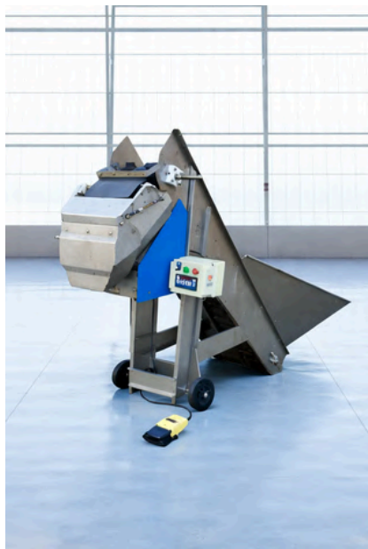
PESADORA LLENADORA MULOT