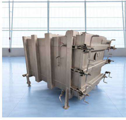
COCEDOR DE PESCADO