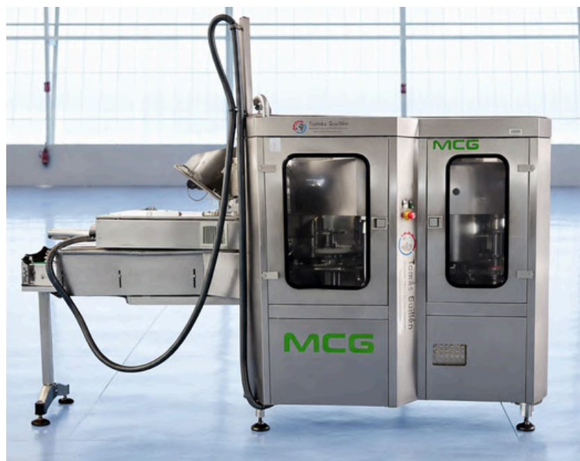
CERRADORA AUTOMÁTICA MCG R-110