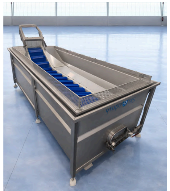
PULMÓN ALIMENTADOR GRUPO HRG