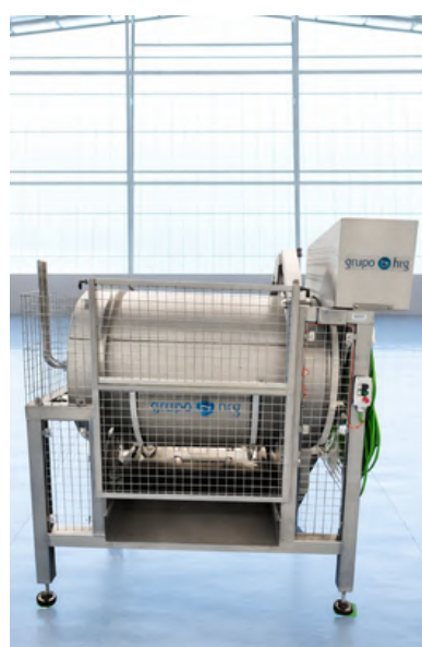
LAVADORA RIZADORA PARA CEFALÓPODOS