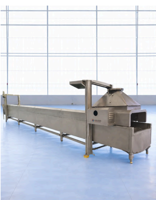
FREIDORA DE ACEITE TÉRMICO MECALSA