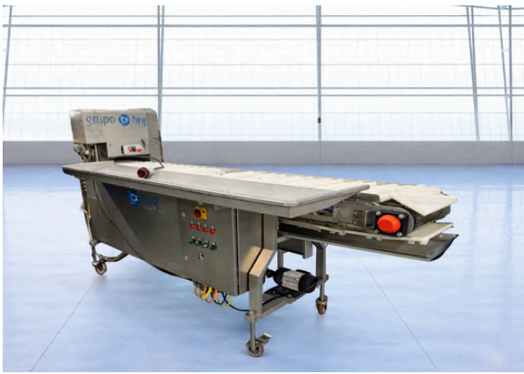
CORTADORA REBANADORA GRUPO HRG