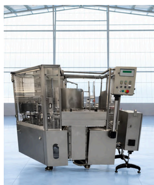
CERRADORA DE LATAS SOMME 444