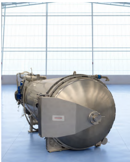
AUTOCLAVE ROTATIVO BARRIQUAND STERIFLOW 5 JAULAS