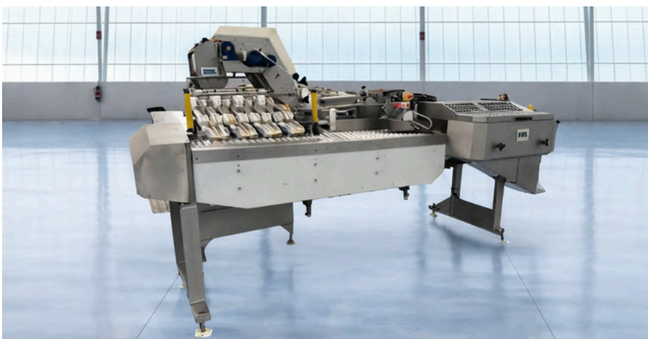
DESCABEZADORA PARA PELÁGICOS VMK