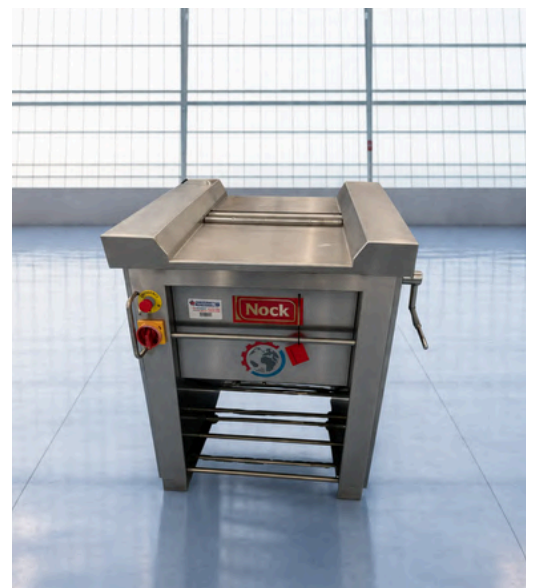
PELADORA DE PIEL DE PESCADO NOCK