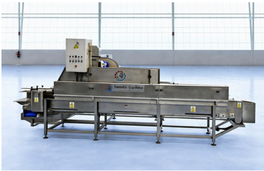
LLENADORA UNIVERSAL TOMÁS GUILLÉN