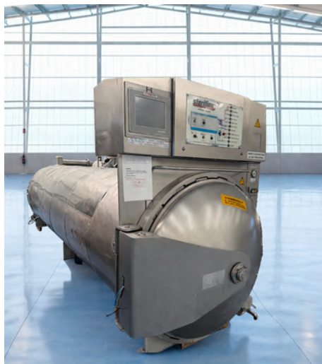
AUTOCLAVE ESTÁTICO BARRIQUAND STERIFLOW 6 JAULAS