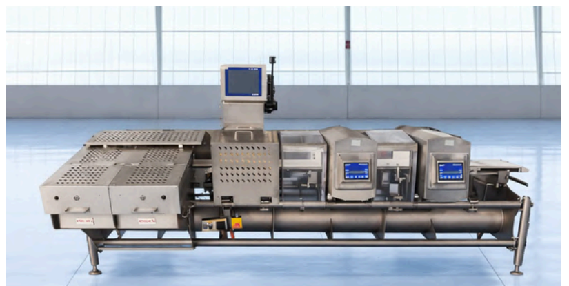
DETECTOR DE METALES DOBLE SAFELINE CON CONTROLADOR DE PESO